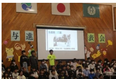
<6年生の発表、受け継がれてきた歴史と未来への思い>