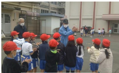
<竹とんぼに挑戦中>

ボランティアの皆さんからも「子供達と触れ合える事ができとても楽しかった」との感想をいただき、1年生の先生方からは「子供達の目が輝いていました。とても良い企画ができました」と感謝のお言葉をいただきました。お手伝いをしてくださったボランティアのみなさん、本当にありがとうございました。