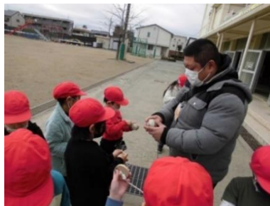
<こま上手に巻けるかな？>