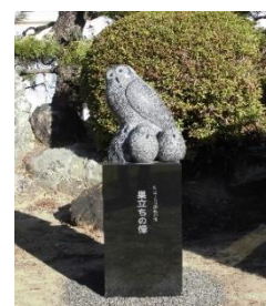
<正門付近に設置されたフクロウをモチーフにした巢立ちの像>