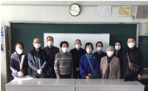
<12/15に参加くださったみなさん>