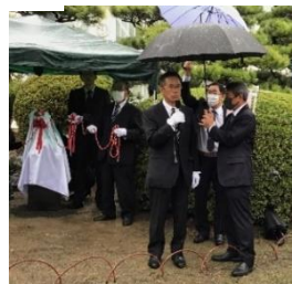
<記念碑製作者、増田幸雄氏からのご挨拶>