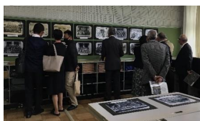
<旧パソコン室に設置された150年の歴史部屋を見学される来賓の皆様>