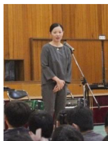
<卒業生でオリンピックの佐藤亜由子さん>